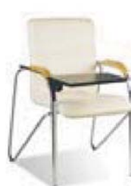
SAMBA T plast