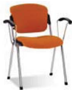
ERA arm chrome