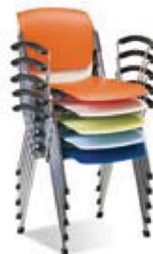
Штабелирование до 15 шт. в стопке