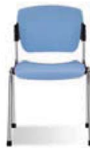
ERA plast chrome