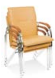
Штабелирование до 4 шт. в стопке