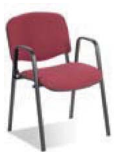
ISO W black