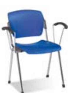
ERA plast arm chrome