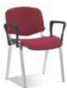
ISO arm chrome