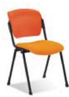
ERA II combi black