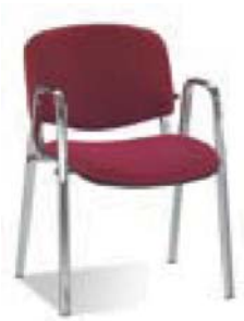
ISO W chrome