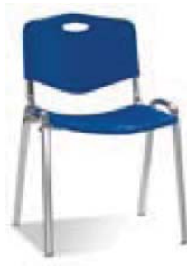
ISO plast chrome