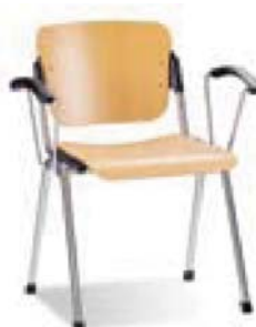
ERA wood arm chrome