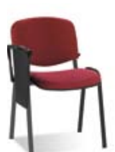
ISO black (опция «Столик конференционный»)