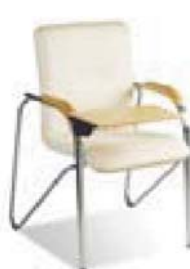
SAMBA T wood