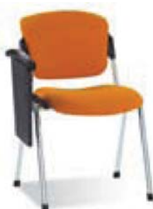
ERA chrome (опция «Столик конференционный»)