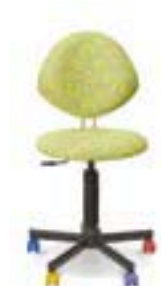
CHAMPION GTS ergo