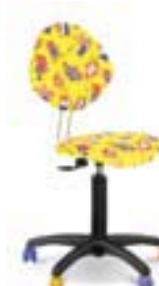
CHAMPION GTS (neylon)