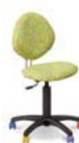
CHAMPION GTS ergo (neylon)